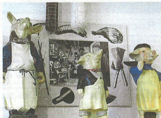
Даже поросята-мясники заканчивают свою жизнь на бойне...

и старые гостиничные вывески, книги и фильмы, монеты и марки. 700 свинок-копилков (из 5000-ной коллекции фрау Вильгельмер) выставлено ещё в одном зале, а в другой комнате каждый посетитель может по своей дате рождения найти