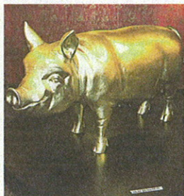
Золотую свинью специально изготовили для зала, рассказывающего о редких породах.

Восхищённая Эрика решила презентовать знакомой ещё одну игрушку, но потом передумала и оставила её себе. «Свиная болезнь» поразила и саму фразу Вильгельмер: теперь она не могла больше спокойно проходить мимо плюшевых поросят на блошином рынке и из каждого отпуска привозила домой очередную экземпляр. Знакомые и родственники стали дарить Эрике свинок при каждом удобном случае, и, когда пя-