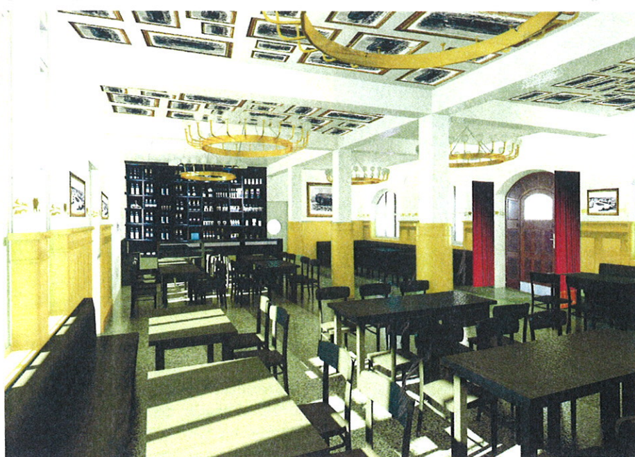
Das Restaurant im Erdgeschoss

Image der Landeshauptstadt – ein Kinderangebot, das der Erlebniswelt am Alten Schlachthof ein i-Tüpfelchen aufsetzen wird.