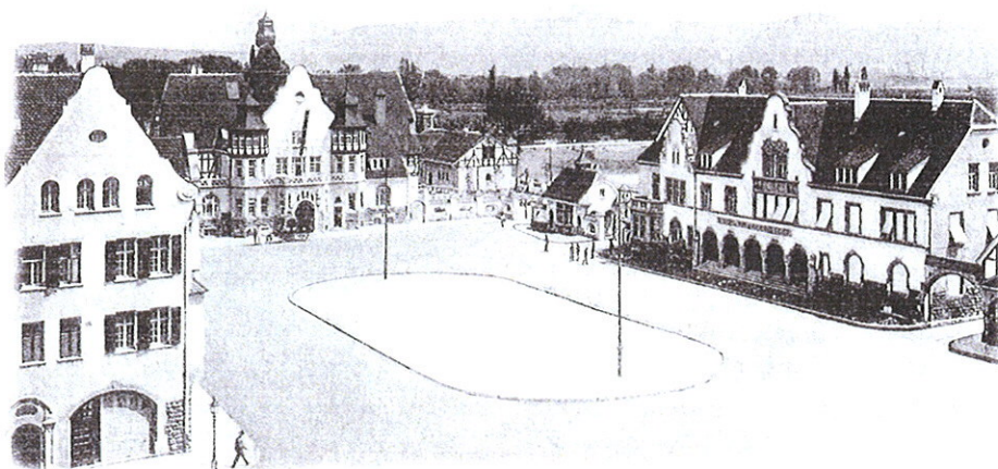
Das frühere Schlachthofgelände